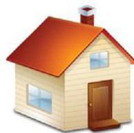
НАЛОГ НА ИМУЩЕСТВО ФИЗИЧЕСКИХ ЛИЦ