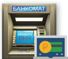
Банкоматы и онлайн-банки