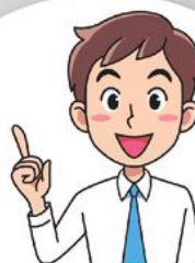
Личный кабинет налогоплательщика для физических лиц