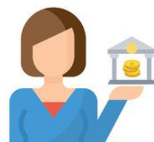
В отделениях банков